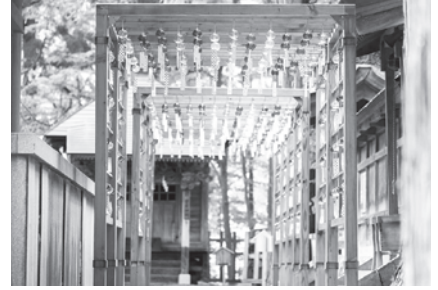
東北の伊勢 熊野大社参拝