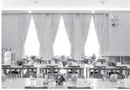
「街なかウェディング」ができるオワソブルー山形