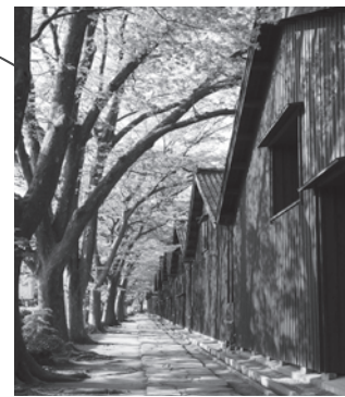
米どころ庄内のシンボル「山居倉庫」