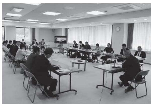
▲振興審議会では様々な視点からの意見共有が図られた

「第6次小国町総合計画」は、2035年度を目標年次とする、中長期的な視点に基づいてまちづくりを進めるための指針であります。本計画については、町の将来像を明らかにし、その実現に向けた基本理念や目標などを示した「基本構想」と、それに基づく施策を計画的、効率的に実施するため具体的な事業を取りまとめた「基本計画」によって構成されています。一方、町で定める計画ではありますが、まちづくりの方向性を示す重要な指針であるため、町民のかたや地域とともに、「これからどのような小国町を目指すのか」という目標を共有するものでもあります。また、町が抱える課題は、様々な要素が複雑に絡み合いながら顕在化しているのが現状です。こうした課題を計画の中で整理し、どのように解決していくのかを明確化することにより、適切な予算の執行と計画的なまちづくりの展開を図るためのものとしても大きな役割を果たしています。総合計画は、目標年次を10年間としています。10年という期間を設けている理由とし