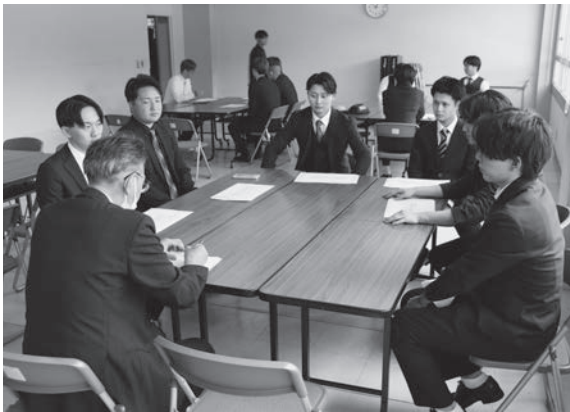
▲成人式の参加者に対して行ったヒアリングの様子

議において素案の作成を行いました。また、町民の各分野の代表に参画いただく小国町振興審議会を開催し、審議会への諮問、審議を経たうえで答申を受けました。このほか、計画案の策定における、有識者による指導組織として、多角的な視点で計画策定全体にわたって指導・助言をいただくまちづくり有識者会議での議論をはじめ、地域サロンに参加した町民のかたや、成人式に参加した若者などに対しての町の課