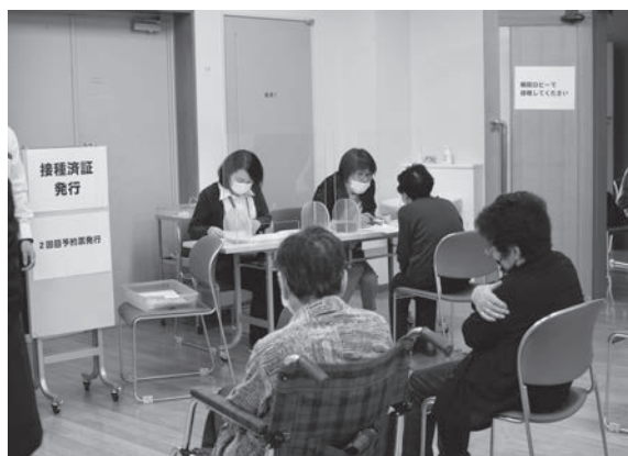
▲コロナ禍は自治体を取りまく環境の大きな変容をもたらした

一方で、少子高齢化や人口減少の急速な進行をはじめ、新型コロナウイルス感染症の拡大に伴う生活様式の変化、激甚化・頻発化する自然災害、情報通信技術や人工知能の進化、若者を中心とする田園回帰志向の高まりなど、自治体を取り巻く環境は大きく変容しています。令和7年度に第5次小国町総合計画の目標年次を迎えたことから、現在の社会構造の変化を的確に捉えながら、諸課題を整理し、持続的、自立的なまちづくりを進めていくために、昨年度、新たな計画となる「第6次小国町総合計画」を策定しました。