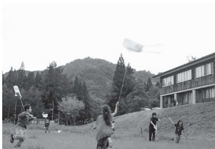
▲作ったたこでたこあげに挑戦！

今回は、保護者を含め12人が参加し、ビニール袋を用いたたこ作りを体験しました。完成後は、思い思いの絵を描いたたこを空へあげました。当日は、風がほとんどなく、たこあげに苦労していましたが、子どもたちは空高くあげようと元気に走り回り、楽しんでいました。