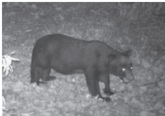
▲町が設置したセンサーカメラで確認したクマの様子

町民のかたにおかれましても、外出する際の身の回りの安全確認や、不要な果実を放置しないなど、日常生活の中においてもクマ被害防止にご協力をお願いいたします。