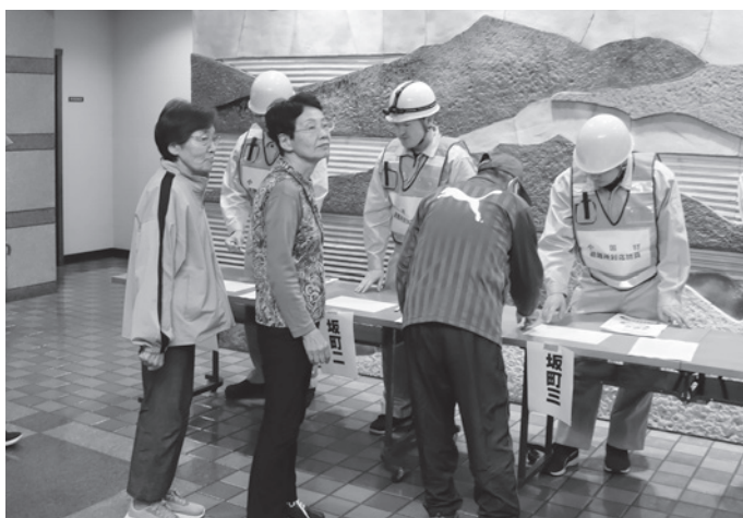
▲避難所での各地区ごとの受付訓練の様子

訓練は、町内で記録的な豪雨が発生した場合を想定して実施され、初動段階での情報収集や避難所の設営、エリアメールからの避難指示による避難など、実践的な取り組みが行われました。このほか、小国町消防団による土のう作製・設置訓練や小国町女性消防隊による操法披露が行われ、参加者全員で防災に対する対応について一層理解を深めていました。