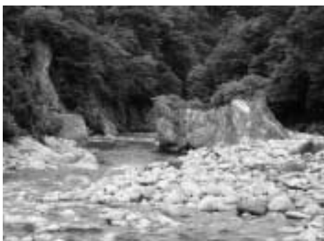
両岸が切り立った地形の溪流は、大雨が降ると一気に増水する

果、雨が降ると一気に川の流量が増加するという現象が見られ、これは、土砂や洪水の氾濫を助長することとなります。このほか、異常気象などの影響により、